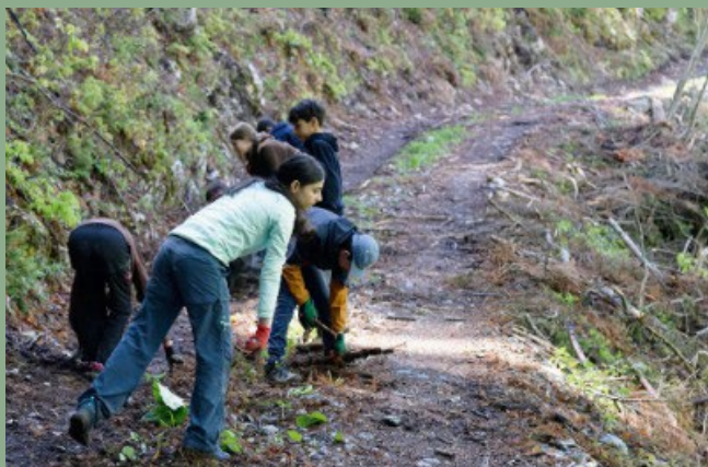
Eindruck der Lagerwoche «Deux im Wald» zwischen der Sekundarschule Wädenswil und dem Établissement secondaire Bussigny

Die Jugendlichen arbeiten in kleinen Gruppen unter der Anleitung von pädagogisch ausgebildeten Waldfachleuten und lernen jeden Tag eine andere Facette der Arbeit im Freien kennen. Sie werden mit neuen Herausforderungen konfrontiert, müssen kommunizieren und sich füreinander einsetzen, um die ihnen anvertrauten Aufgaben zu bewältigen.